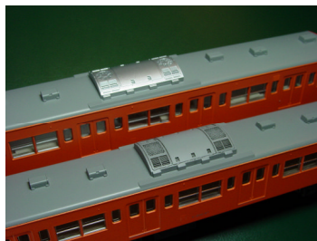
▲取付例：KATO 製 201 系

左：AU75 (H) [発売中] 右：AU75 (H) <フック狭> ※違いが判りますか？