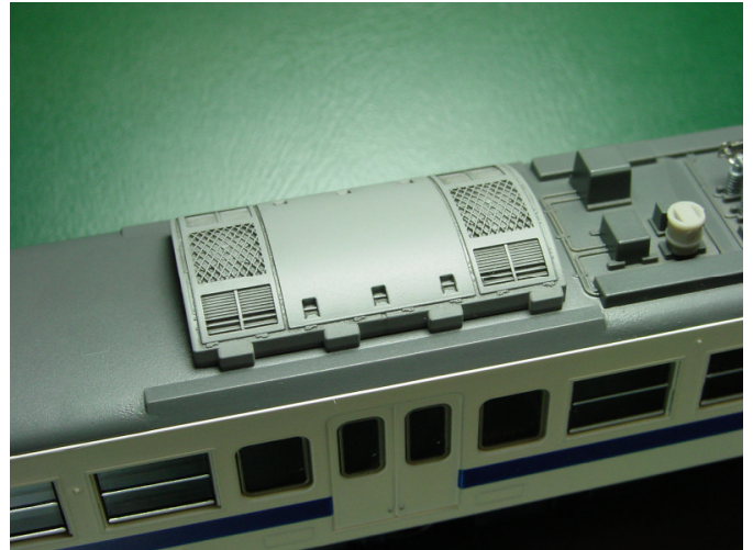
▲取付例：TOMIX 製 415 系 100 番台